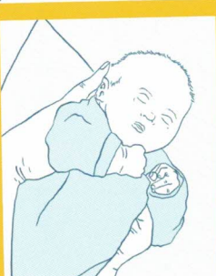
بلند کردن نوزاد

Herausgeber: Nationales Zentrum Frühe Hilfen, NZFH, NZFH در مرکز فدرال برای راهنمایی صحتی (BZgA) Bundeszentrale für gesundheitliche Aufklärung, BZgA یا همکاری موسسه جوانان آلمان (Deutsches Jugendinstitut, DJI) www.bzga.de , www.fruehelfen.de Druck: Kunst- und Werbeindruck, Bad Oeynhausen Auflage: 1.100.11.18, Stand: September 2018 Bestellnummer: 16000554 (Farsi), E-Mail: order@bzga.de